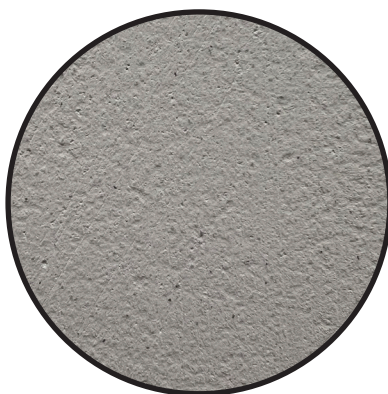
Lett strukturert overflate